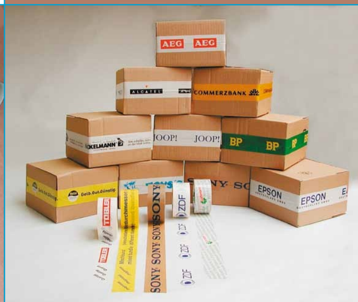
Farben, Motiv und Ausführung nach Ihren Wünschen.