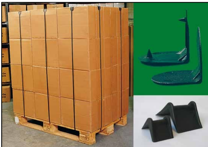
Kantenschutzecken aus Recycling-Polypropylen (PP)