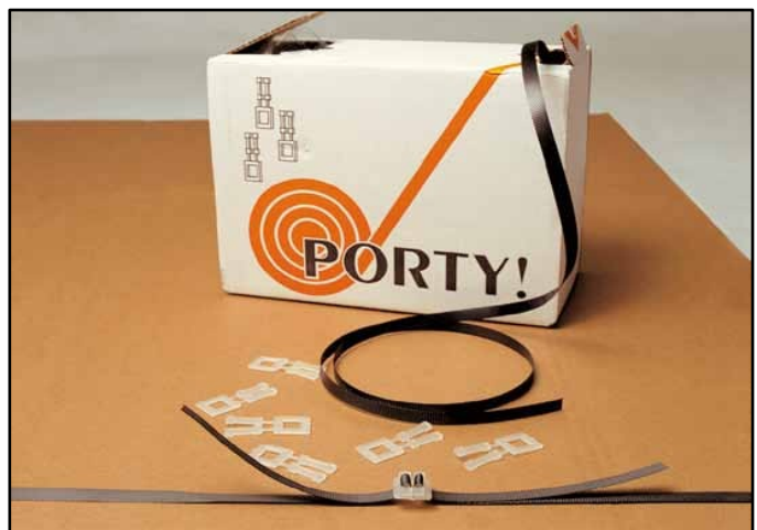
PORTY Umreifungs-Set mit Verschluss-Schnallen