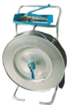
Abwickler SEK629 verzinkt, mit Ablagefach, für Kunststoffband in 13 und 16 mm, Kern Ø 406 mm Best.-Nr.: 59 10 03