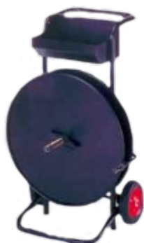
Abwickler CA540 Stahl, lackiert, Ablagefach, für PP u. PET-Bänder bis 32 mm, Kern Ø 200 und 406 mm Best.-Nr.: 59 10 02