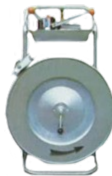
Abwickler QPWK verzinkt, mit Bandbremse, Ablagebehälter, für Kunststoffband in 9-19 mm Kern Ø 406 mm Best.-Nr.: 59 10 04