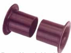
Best.-Nr. 59 60 50 Kunststoff-Abrollhilfe