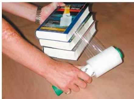
Ideal zum Bündeln...