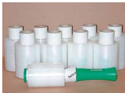
10 Rollen und 1 Griff je Karton