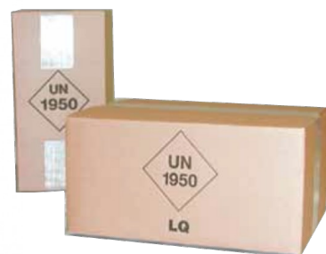
Kartong mit Filamentband