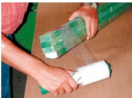
...und zum Fixieren!