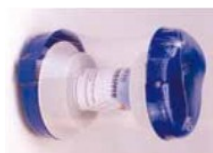
Best.-Nr. 59 60 51 Komfort-Abrollhilfe mit Bremse