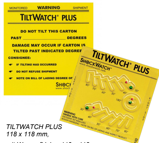
TILTWATCH PLUS 118 x 118 mm,

Best.-Nr. 49 32 50 Kippindikator TILTWATCH PLUS