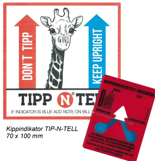
Kippindikator TIP-N-TELL 70 x 100 mm

Best.-Nr. 49 30 00 Kippindikator TIP-N-TELL