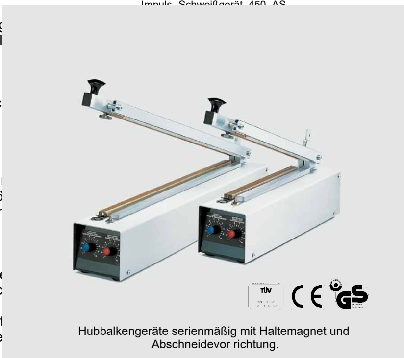
Hubbalkengeräte serienmäßig mit Haltemagnet und Abschneidevorrichtung.