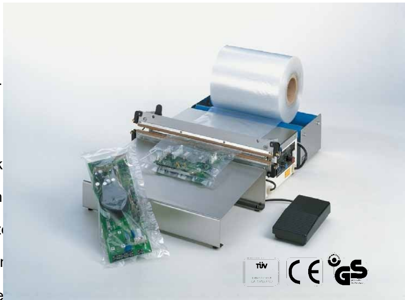
Impuls-Schweißgerät 450 AS

Der Schweißimpuls wird automatisch ausgelöst. Erst nach Ablauf der vorgewählten Schweiß- und Kühlzeit öffnet sich der Hebelarm selbsttätig und das verschweißte Folienmaterial kann entnommen werden.