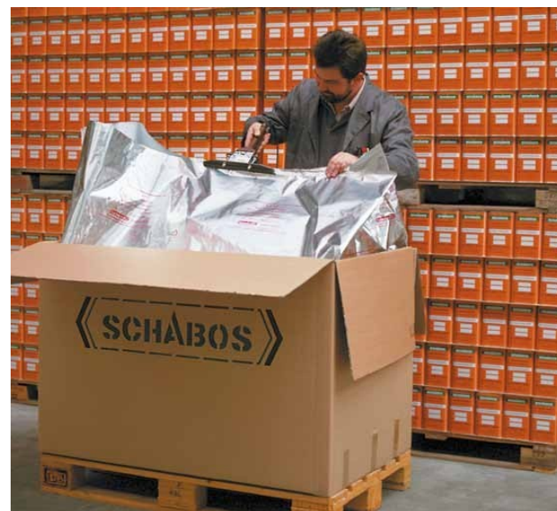
Kisteneinsatz inkl. Streckverschluss (zum Verschweißen von oben).