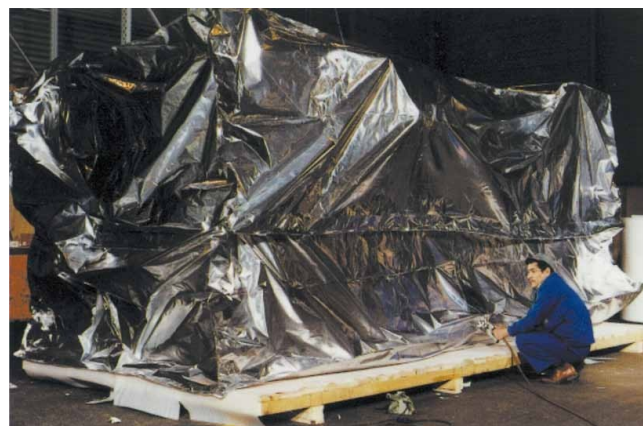
Alu-Verbundhaube mit Bodenblatt (fertig verschweißt).