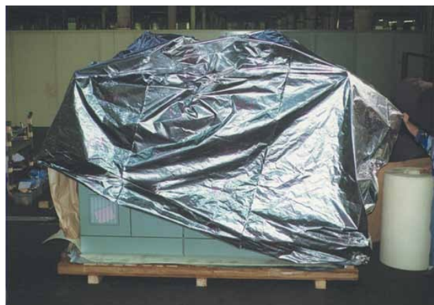
1. Maßgenaue Haube wird übergestreift.

Die Zusammensetzung der Verbundfolie und die Menge der Trockenmittel können je nach Klima des Empfängerlandes variiert werden (siehe Trockenmittel Seite 53).