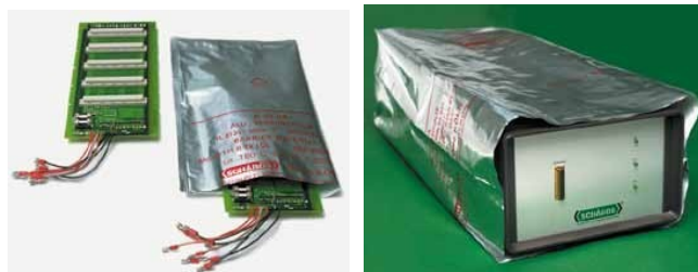
Flachbeutel und fertige Kisteneinsätze (Caseliner) aus allen siegelfähigen Verbundfolien liefern wir nach Ihren Wünschen.