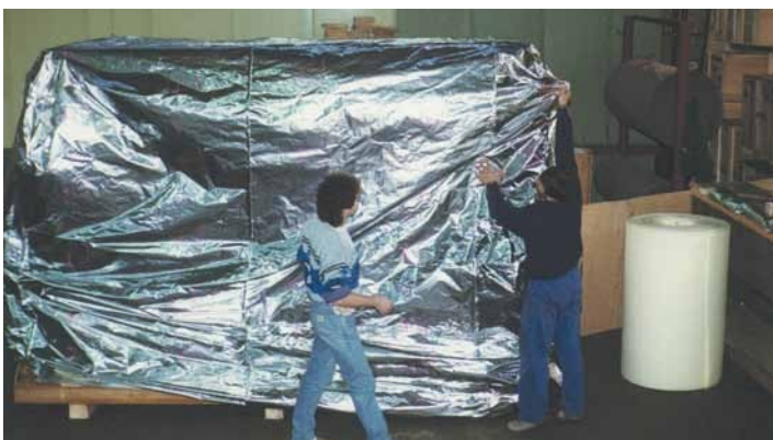
2. Die Alu-Verbundfolie wird gerade gezogen.