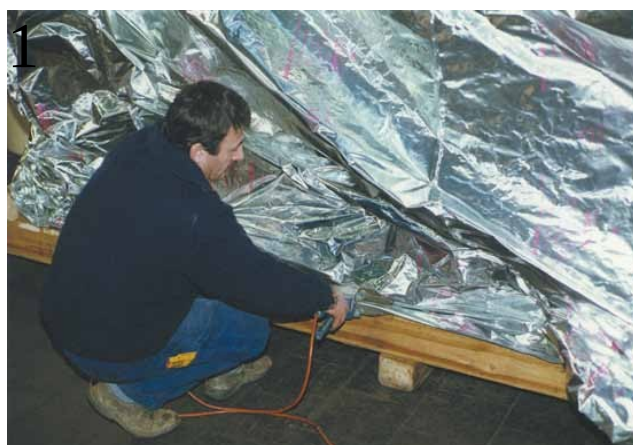
3. Haube und Boden werden zusammenschweißt.