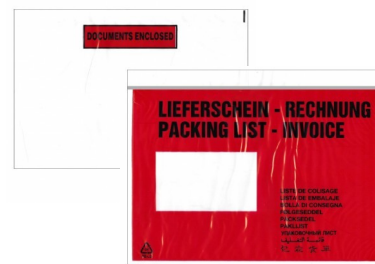
Lieferschein-Taschen DIN A5 quer

Quick – einlagige Selbstklebetaschen , diese innovative Dokumententasche spart durch den einlagigen Aufbau fast 50% PE-Folie und 70% Klebefläche. Neu ist der einlagigen Aufbau, dadurch handelt es sich eigentlich nicht um eine Tasche, sondern um eine Folie, die um die Papiere herum geklebt wird.