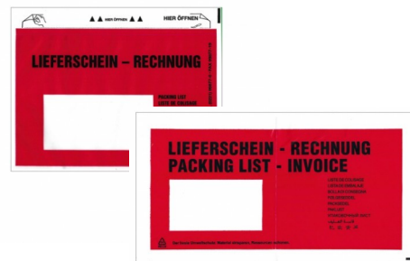
PE-Tüten mit Anklebeverschluss

Lieferschein-Tüten aus PE-Folie , selbstklebend, wasserdicht.