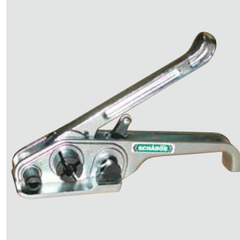
Bandspanner P 390 aus Zink, bruchsichere Ausführung, stabil, für PP und Polyesterband 12-19 mm Best.-Nr. € 59 18 20 Bandspanner P 390 168,-