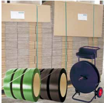
Die Abwickler mit einem Kern von Ø 406 mm können mit PET-Band oder PP-Umreifungsband eingesetzt werden.