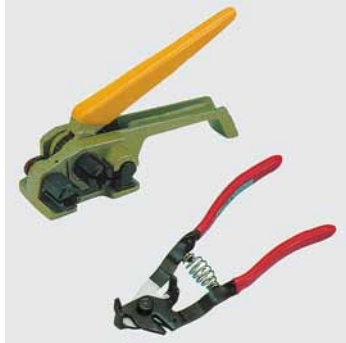
Bandspanner P 260 für 9-13 mm Kunststoffband Zange P 180 Best.-Nr. € 59 18 16 Bandspanner P 260 98,- 59 18 00 Zange P 180 21,-

Handgeräte zum Spannen, Plomben-Verschlußgeräte und Abwickler für Kunststoff-Umreifungsband. Die Spanngeräte sind mit Polyester- und PP-Umreifungsbändern einsetzbar.