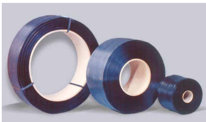
PP-Band Rollen mit verschiedenen Kernen.