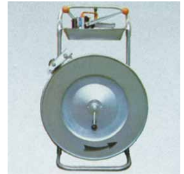
Abwickler QPWK , verzinkt, mit Bandbremse, Ablagebehälter, für Kunststoffband 9 bis 19 mm Best.-Nr. € 59 10 04 Abwickler QPWK 686,40