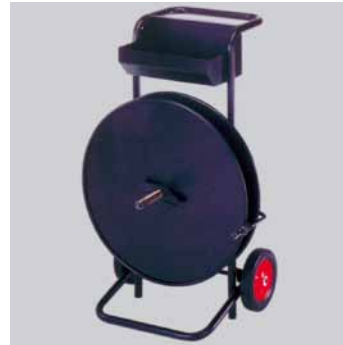
Abwickler CA 540 , Stahl, lackiert, Ablagefach, für PP u. PET-Bänder bis 32 mm, Kern Ø 200 u. 406 mm Best.-Nr. € 59 10 02 Abwickler CA 540 320,-