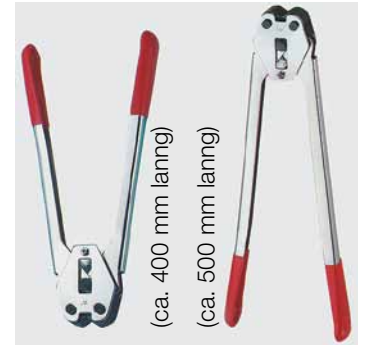
Plomben-Verschlußgeräte für PP-Kunststoffband Best.-Nr. € 59 17 13 C 3004/13 mm 87,- 59 17 16 C 3015/16 mm 98,- 59 17 19 C 3026/19 mm 110,-