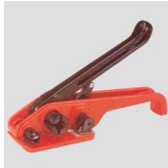
Bandspanner P 310 verstärkt für PP, PET, Cordband 9-19 mm Best.-Nr. € 59 18 18 Bandspanner P 310 132,-