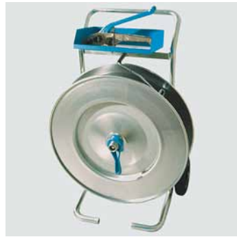
Abwickler SEK 629 , verzinkt, mit Ablagefach, für Kunststoffband 13 und 16 mm, Kern Ø 406 mm Best.-Nr. € 59 10 03 Abwickler SEK 629 362,-