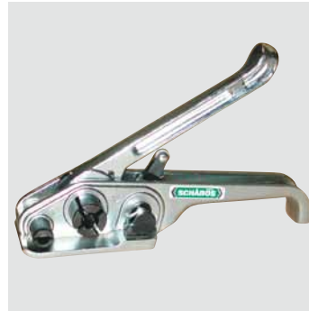
Bandspanner P 390 aus Zink, bruchsichere Ausführung, stabil, für PP und Polyesterband 12-19 mm Best.-Nr. € 59 18 20 Bandspanner P 390 168,-