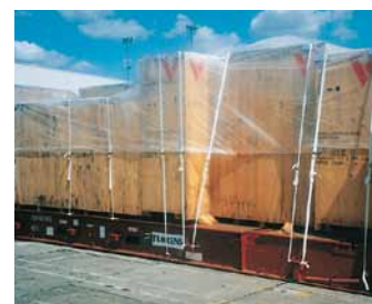
Ladung fertig verzurt