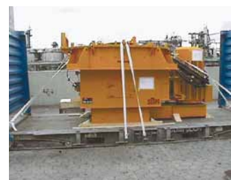
Maschine vor dem Containerstau