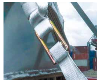
Doppelstegschnalle DSS 40 fachgerecht verzurret