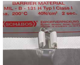
Gewebeband 25 mm mit Klemme B8