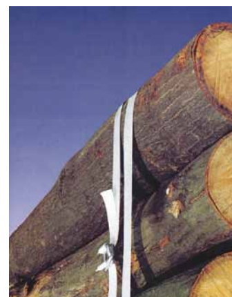
Ladungssicherung in der Forstindustrie

Preis Anpassung aufgrund veränderter Rohstoffsituation vorbehalten