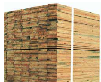
Ladungssicherung in der Holzindustrie