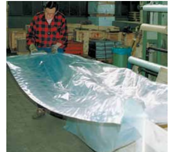
Flachfolie als Kisteneinsatz