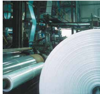
PE ist grundwasserneutral und zerfällt beim recyceln in Kohlendioxid und Wasser