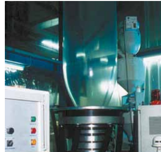
Polyethylen wird als MDPE- oder LDPE-Ausführung geliefert