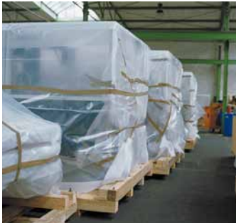
Schutz vor Regen und Staub