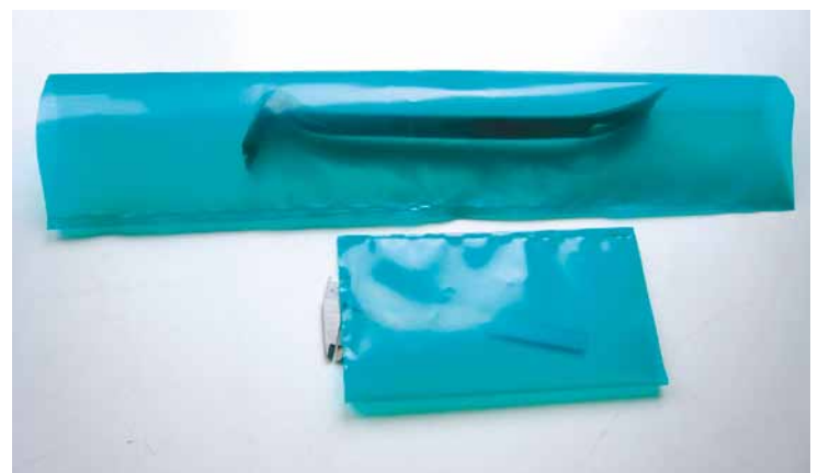
SCHABOCOR Coexfolien dampfen nur nach innen aus

– zum Schutz von Eisen, Stahl, Kupfer, Messing, Bronze, Aluminium und andere Metallen.