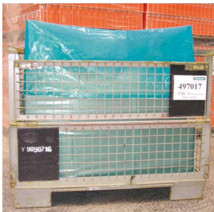
SCHABOCOR Coexfolien dampfen nur nach innen aus

schützen Metalle durch direkten Kontakt und aus der Gasphase. Die VCI-Inhibitoren verdampfen langsam und werden dann von der gesamten Metalloberfläche adsorbiert, dadurch werden auch schwer zugängliche Stellen wie Falze, Bohrungen usw. geschützt.