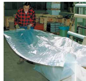
Flachfolie als Kisteneinsatz