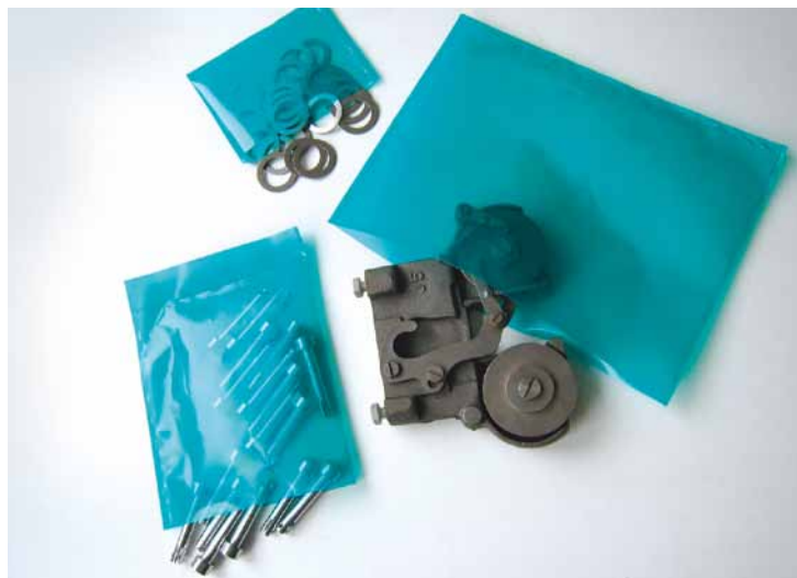
SCHABOCOR Flachbeutel sind in verschiedenen Größen lieferbar

SCHABOUNI-VCI-Folien sind recyclebar und können dem Hausmüll oder der Deponie beigegeben werden.