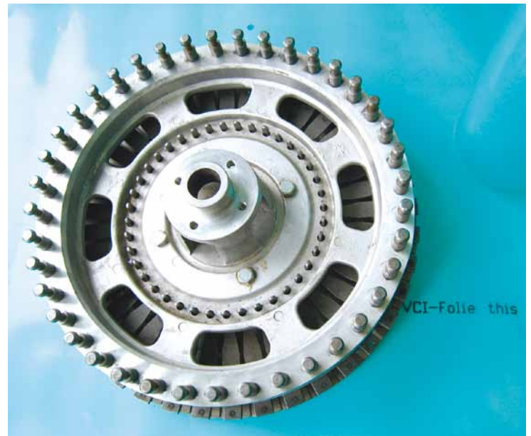
SCHABOCOR VCI-Folien sind auch bedruckbar

Die Schutzdauer: Bei Innenlagerung: mindestens 24 Monate Bei Außenlagerung: mindestens 6 Monate