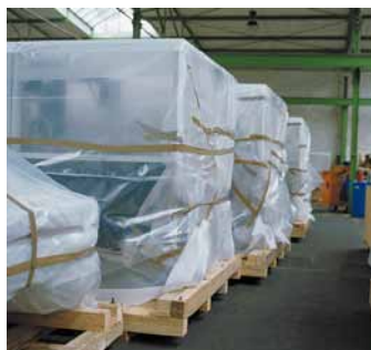
Schutz vor Regen und Staub