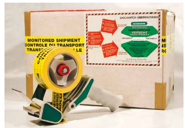
Versandkarton mit Shockwatch-Einheit und Warnband.

Jede SHOCKWATCH-Einheit besteht aus einem selbstklebenden Schockindikator, einem 3-sprachigen Warnaufkleber, wahlweise in DIN A4 oder DIN A5, sowie einem kleinen Aufkleber zum Anbringen auf den Frachtpapieren.