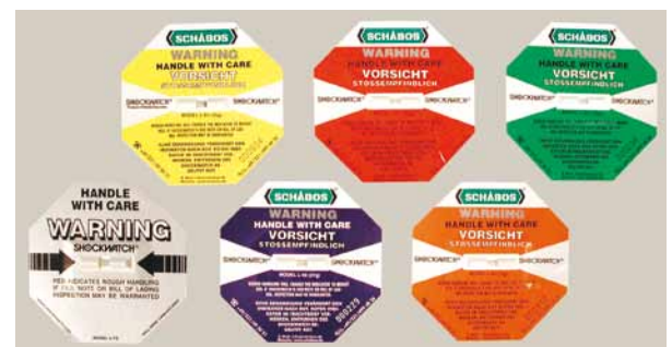
Shockwatch mit 6 verschiedenen G-Werten lieferbar.

Bitte beachten Sie, dass der Versand der vereisten Ware zu Ihnen mit einem Spezialkurier durchgeführt werden muss, damit die Indikatoren nicht vorzeitig auslösen. Frachtkosten gewichtsabhängig ab € 40,-. Mindestabnahme 50 Stück, darunter € 15,- Mindermengenzuschlag