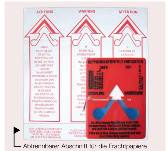
Kippindikator TIP-N-TELL 70 x 100 mm, Aufkleber 150 x 165 mm, einschließlich Aufkleber für die Begleitpapiere.

Ein Warnaufkleber in 3 Sprachen mit einem Abschnitt für die Frachtpapiere wird mitgeliefert.