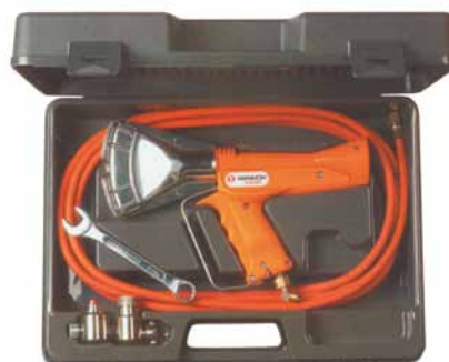
Handschrumpfgerät RIPACK® 2200 mit Koffer, Druckregler und 8 m Gasschlauch