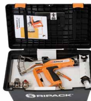
Handschrumpfgerät RIPACK® 3000 mit Koffer, Druckregler und 8 m Gasschlauch