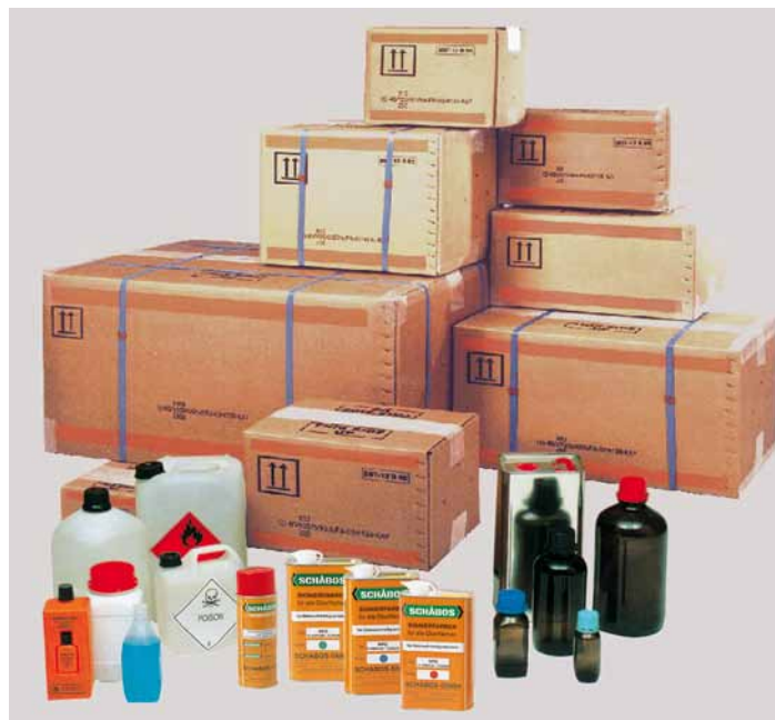
UN-zugelassene Verpackungen für „Gefährliche Güter“

Typ III (Z) = Stoffe geringerer Gefährlichkeit