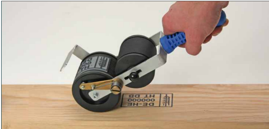
Die Rollen werden in Standardausführung mit Plastik-Ink Farbrolle geliefert!

EXPORTVERPACKUNG Schablonen · Signieren · Sichern · Schützen