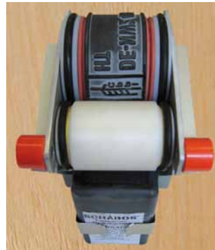
Gerät in der Arbeitspause