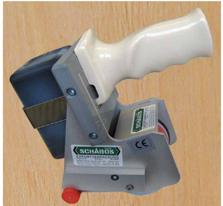
Rollstempel in Arbeitsstellung

Das Klischee wird zuerst an einer Breitseite und dann über die gesamte Länge in die TELOS-Matte eingedrückt. Die O-Ringe auf der Druckrolle und der Übertragungsrolle sind Verschleißteile und werden paarweise ausgetauscht.