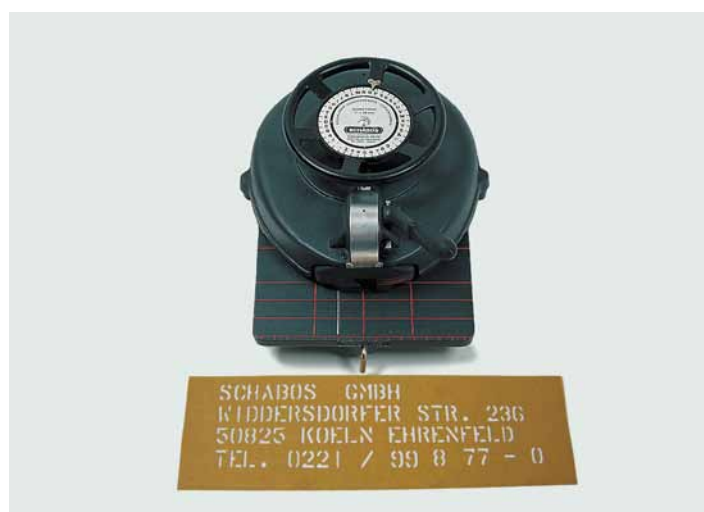
DIAGRAPH Stanzmaschinen Schrifthöhe 13 und 25 mm