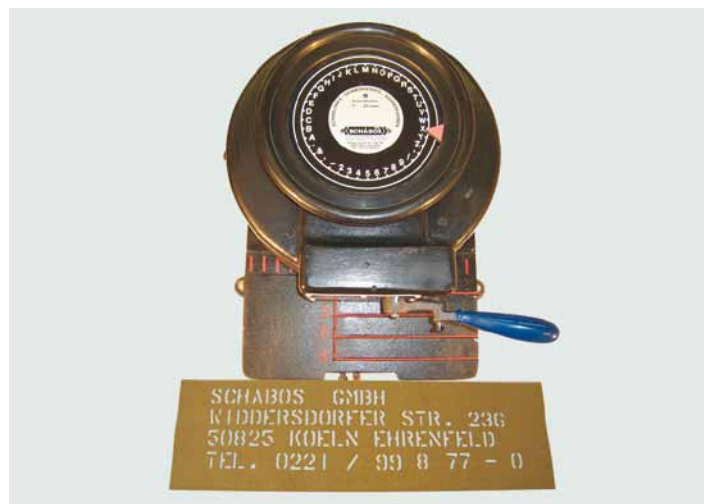
MARSH Stanzmaschinen Schrifthöhe 6, 13, 20, 25 mm

Die gebräuchlichsten Schrifthöhen sind: 6, 13, 20, 25 und 50 mm in lateinischer Schrift. Andere Größen auf Anfrage.