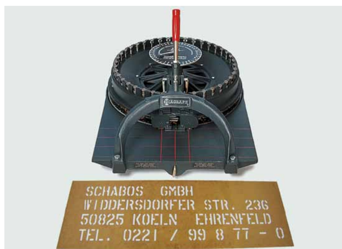
DIAGRAPH Stanzmaschinen, Type Jumbo Schrifthöhe 45 mm lateinisch, 45 mm kyrillisch auf Anfrage