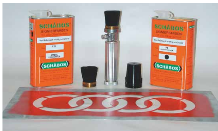
Grundausrüstung Füllbürste mit 38 mm Durchmesser