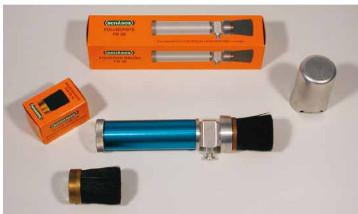
Füllbürste FB 26 mit austauschbarem Bürstenkopf

«SCHABOS»® Schablonen-Füllbürste, das ideale Signiergerät zum Markieren von rauhen Oberflächen, wie z.B. grobes, ungehobeltes Holz oder Jutesäcke.