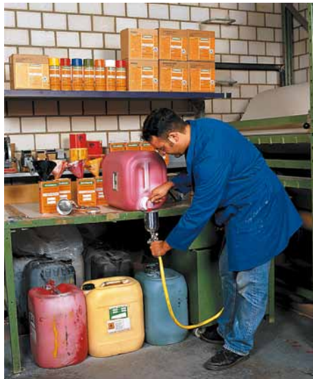
Bei Erstbestellung wird ein Abfüllhahn für die Spritzfarbe mitgeliefert.