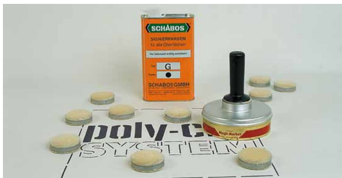
Signiergerät C71 für raue Oberflächen