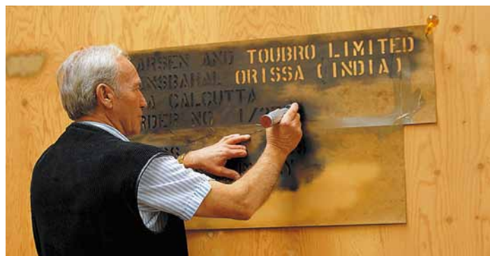
Füllbürsten zum Markieren von Kisten, Jutesäcken usw.