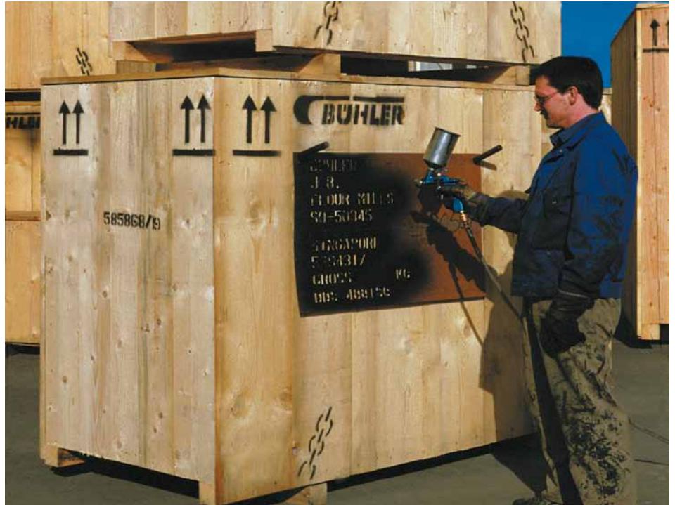
Signierung der Exportverpackung mit Spritzpistole.

Wir empfehlen jedoch aus Sicherheitsgründen mit Atemschutz und Schutzbrille zu arbeiten.