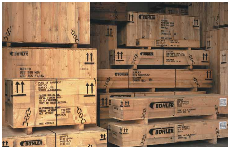
Mit SCHABOS Spritzfarbe fertig markierte Kisten vor dem Abtransport.