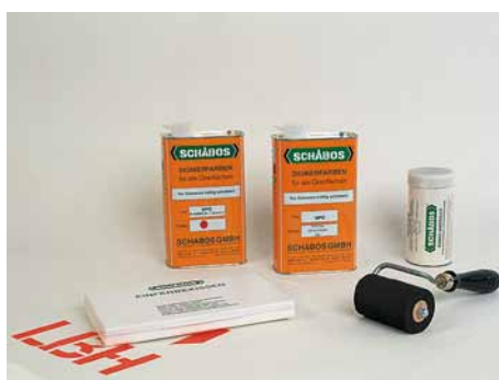
Grundausrüstung mit Handroller 8 cm