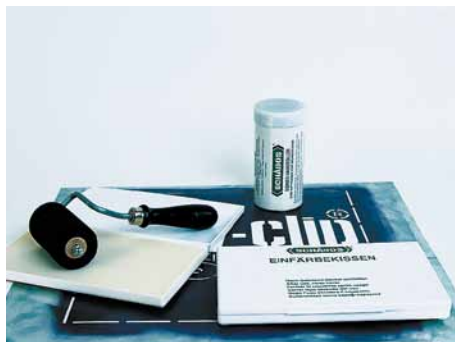
Handroller und Einfärbekissen

Nach längeren Arbeitspausen nur einige Spritzer NPO Verdünner auf Rolle und Kissen geben oder neue Farbe auf das Einfärbekissen gießen. Nur NPO Verdünner verwenden, da sonst Rolle und Kissen aufquellen und unbrauchbar werden.