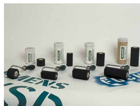
4 verschiedene Rollenausführungen lieferbar