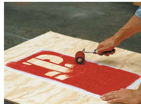
Signierung mit SCHABOS Handroller