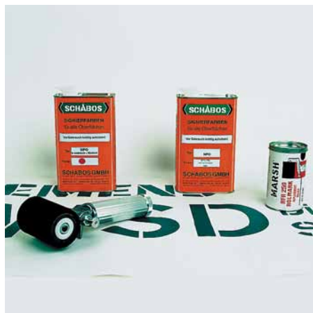
Grundausstattung mit MARSH-Füllroller