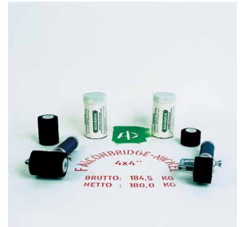
SCHABOS-Füllroller in 4 und 8 cm Breite