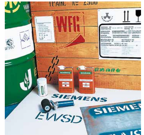
Saubere Signierung mit SCHABOS-Füllroller