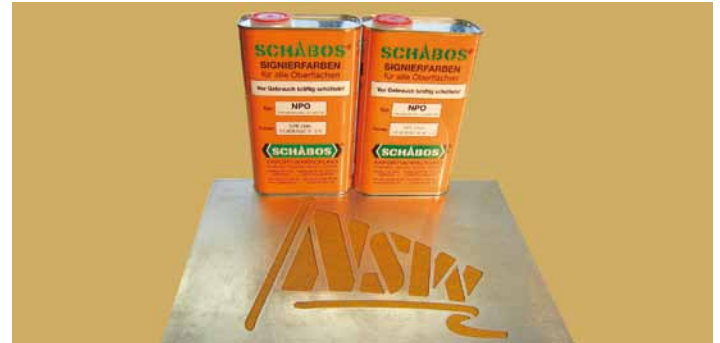
Verdünner 520 und Verzögerer 521