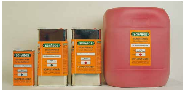
SCHABOS Signierfarbe in vielen Behältergrößen lieferbar