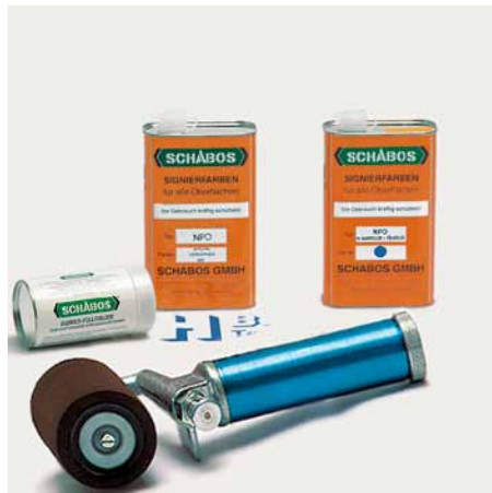
Grundausstattung Füllroller 8 cm Rollenbreite

Markierung auf allen glatten oder porösen Oberflächen: Metalle, Kunststoffe, Folien, Papier, Holz, Säcke usw.