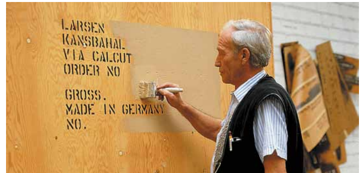
Löschfarbe zum Auslöschen falscher oder alter Markierungen

SCHABOS ® SIGNIERFARBE Typ NPO für alle Oberflächen, auf Alkoholbasis. SIGNIERFARBE Typ NPO-W für alle Oberflächen, auf Wasserbasis.