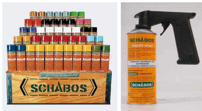
SCHABOS Signier-Sprays in vielen Farbtönen lieferbar