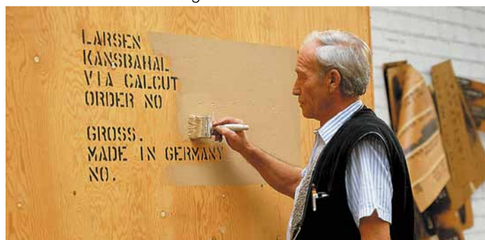
Löschfarbe zum Auslöschen falscher oder alter Markierungen

SCHABOS ® SIGNIERFARBE Typ NPO für alle Oberflächen, auf Alkoholbasis. SIGNIERFARBE Typ NPO-W für alle Oberflächen, auf Wasserbasis.