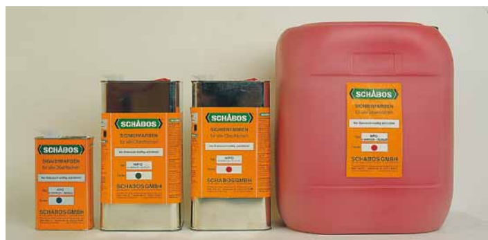
SCHABOS Signierfarbe in vielen Behältergrößen lieferbar