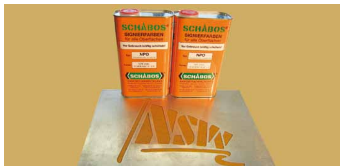
Verdünner 520 und Verzögerer 521