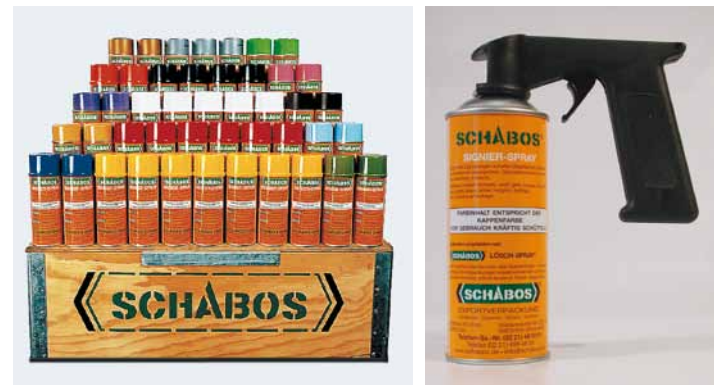
SCHABOS Signier-Sprays in vielen Farbtönen lieferbar