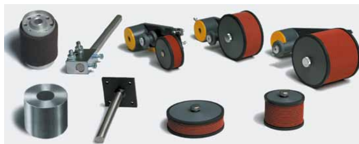
Druckrolle, mit Farbe getränkte PORELON-Rolle