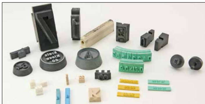
Flexoklischees und Gummitypen nach Ihren Vorgaben