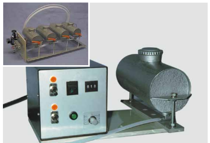
KODIER 52 Dosierschaltung mit Farbbehälter, 3 ltr. Inhalt

Farben, Klischees und Verbrauchsmaterialien finden Sie auf den nachfolgenden Seiten.