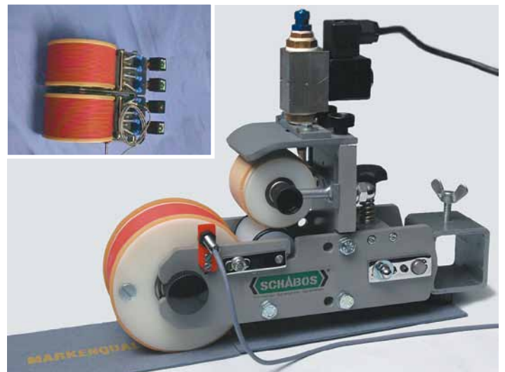
KODIER 51 Signierdruckwerk mit Dosierschaltung

Farben, Klischees und Verbrauchsmaterialien finden Sie auf den nachfolgenden Seiten.