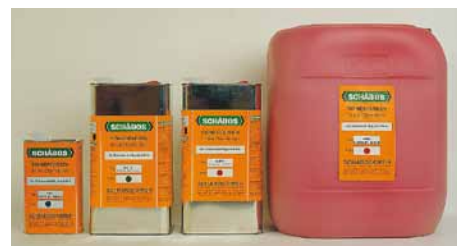
Druckfarben in vielen Behältergrößen

Lösungsmittel können als Verdüner, Beschleuniger oder Verzögerer von Druckfarben und als Reinigungsmittel der meisten Druckmaschinenteile eingesetzt werden. Mit den beiden Verdünnern SCHABOS NPO 520 (Beschleuniger) oder NPO 521 (Verzögerer) können alle SCHABOS Druck- und Kodierfarben auf die entsprechenden Oberflächen eingestellt werden.