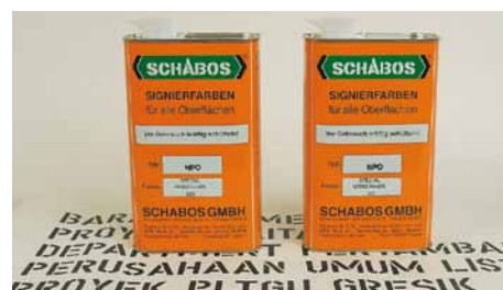
Verdünner XC 520, Verzögerer XC 521