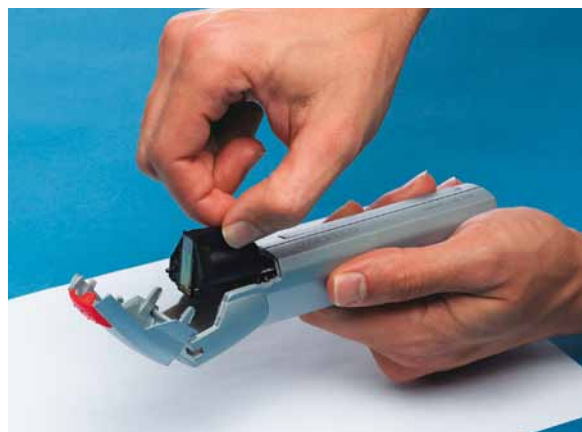
Der Schreibkopf und die Farbdruckpatrone sind eine Einheit