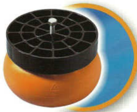
Die Spacer für SKIDMATE®

Durch die hohe Widerstandsfähigkeit und den geringen Lagerplatzbedarf sowohl im Einweg- als auch im Mehrwegbereich einsetzbar.